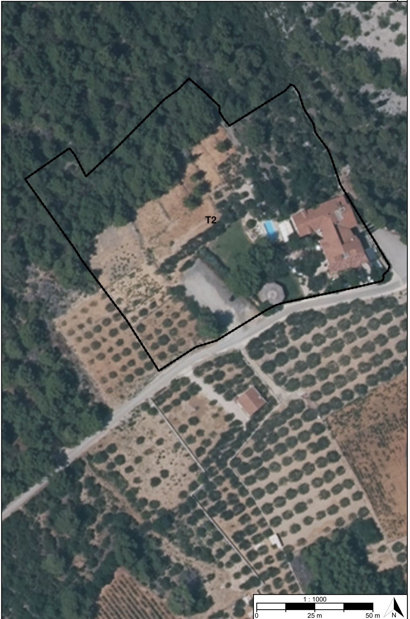
Postupak transformacije Urbanistički plan uređenja dijela ugostiteljsko-turističke zone "Boškinac"